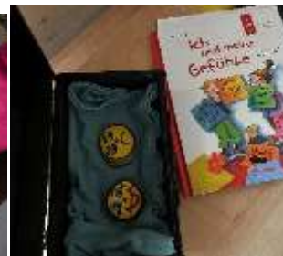
Kindersprechstunde zum Thema Gefühle